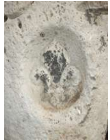
De Sammeron à La Ferté-sous-Jouarre : borne 31 vers la Haute-Borne, borne 32 en face de l'école des petits meuliers