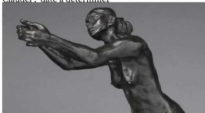
L'Implorante , de Camille Claudel. Musée de Nogent-sur-Seine