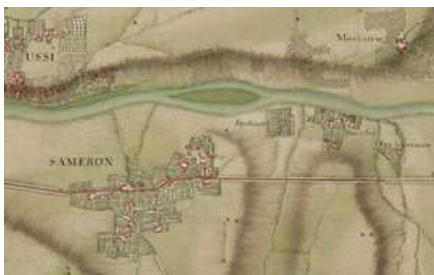
La route royale de Paris jusqu'en Allemagne traversant Sammeron

Daniel-Charles Trudaine, directeur des Ponts et Chaussées, créé en 1744 un Bureau des Dessinateurs pour centraliser l'ensemble des plans, notamment ceux parvenus de province. Ces cartes en couleurs réalisées entre 1745 et 1780 forment un atlas dit «de Trudaine» conservé aux Archives Nationales. C'est le premier maillon d'un processus qui aboutit à la restauration et à la mutation du réseau routier sous le règne de Louis XV. Ces plans permettent alors de définir la durée des travaux de corvée et d'établir le coût des aménagements, qui sont ou non validés par le roi.