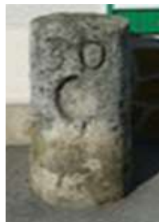
Sammeron : borne 30 au 44 rue de Metz

Les bornes milliaires portaient toutes une fleur de lys. À la Révolution, un décret de la Convention incita les citoyens à faire disparaître toutes traces de royauté. Les fleurs de lys furent alors souvent martelées, laissant l'ovale vide de